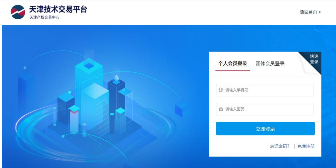
图 2 技术平台登录界面

技术平台对转让方提交的信息发布申请材料的规范性进行审核。符合信息披露要求的，技术平台予以受理；不符合信息披露要求的，技术平台将审核意见及时告知转让方或转让方经纪会员，要求转让方进行调整。