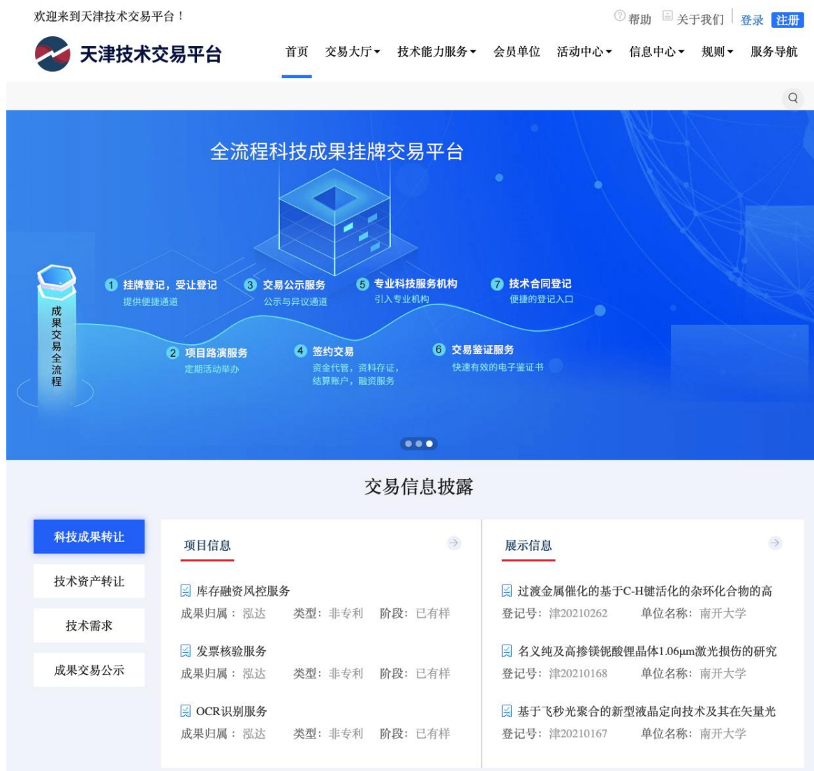
图 3 技术平台信息发布展示页面

发布交易信息时间不少于 10 个工作日,自技术平台网站发布次日起计算。信息发布期自首次发布之日起累计不超过 12 个月(在天津科技成果网同步发布)。