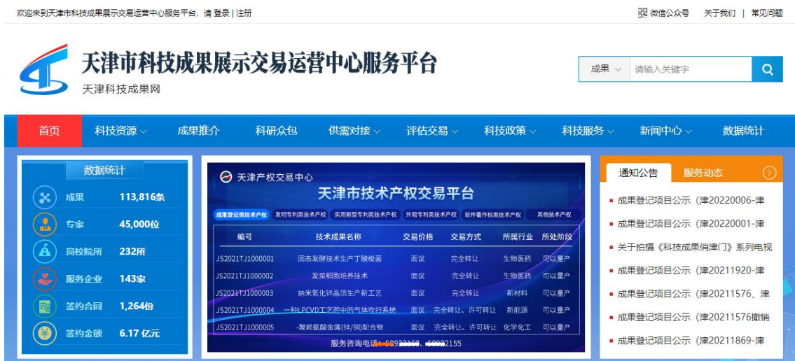
图 4 天津科技成果网项目展示页面

转让方在公告期间不得擅自变更或者撤销公告中的内容和条件。交易行为须经批准单位同意且确需变更公告内容和条件的，转让方应当取得交易行为批准单位书面同意，并由技术平台网站重新发布信息披露公告，重新计算公告时间。